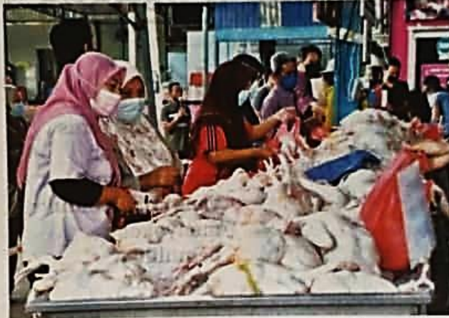
ORANG ramal mendapatkan bekalan ayam yang harga silingnya ditetapkan RM9.40 sekilogram bermula hari ini. - GAMBAR HIASAN

Firma penyelidikan itu berkata, keputusan Lembaga