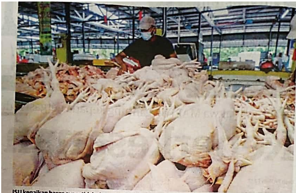
ISU kenaikan harga ayam tidak akan dapat ditangani sekiranya kerajaan tetap mengambil pemain gergasi swasta yang sama sebagai penasihat dalam Pasukan Khas Jihad Tangani Inflasi. - GAMBAR HIASAN