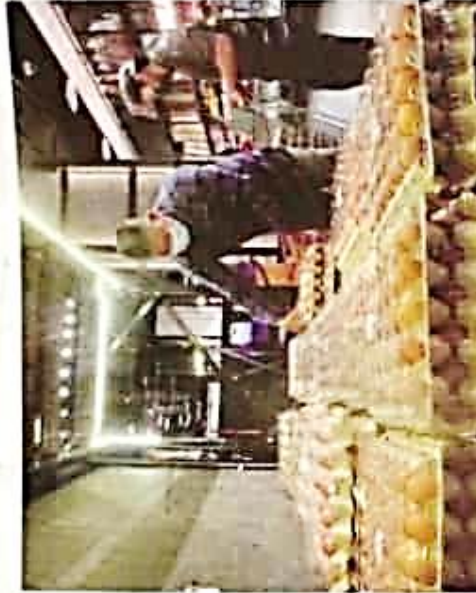
Orang ramai membeli telur yang dijual di sebuah pasar raya di Kuala Lumpur, semalam.

Berdasarkan simulasi Jabatan Perangkaan Negara, katanya, kadar inflasi Malaysia bagi Mei boleh memecah sehingga 11.4 peratus namun dasar subsidi membantu membendung inflasi di negara ini pada tahap 2.6 peratus.