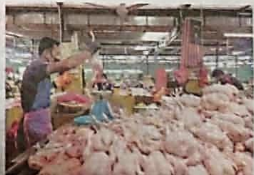
PENIAGA sukar untuk mematuhi penetapan harga siling baharu ayam berikutan terikat dengan harga yang ditawarkan pembekal.

"Harap pemborong dapat turunkan harga bagi membolehkan kami menjual ayam ikut harga ditetapkan kerajaan," katanya.