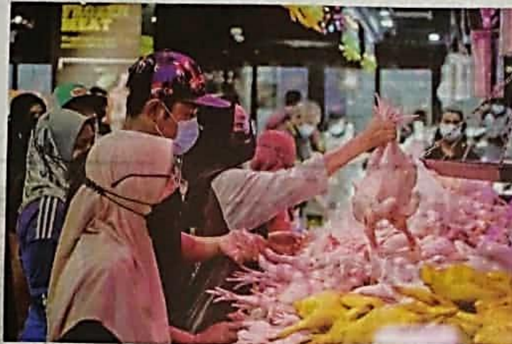
PENGGUNA berharap agar pihak peniaga mematuhi penetapan harga siling ayam yang dibuat kerajaan. —LAMBAR HIASAN

"Sebelum ini, kita dengar banyak alasan kenaikan harga ayam dan telur adalah disebabkan permintaan tinggi dan barangan