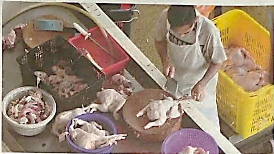
KERAJAAN menetapkan harga siling runcit ayam standard untuk Semenanjung pada RM9.40 sekilogram bermula hari ini.

menjadi isu terlalu besar berbanding ayam kerana kenaikannya pun hanya beberapa sen," katanya.