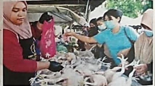
ORANG ramal membeli ayam yang dijual pada harga RM7.90 sekilogram sempena PJKM di Dataran Kesedar Gua Musang semalam.

"Saya mengambil peluang untuk membeli enam ekor ayam yang dijual pada harga lebih murah. Kami berharap kerajaan membuat jualan barangan dapur lebih murah secara kerap selepas ini bagi membantu golongan berpendapatan rendah," katanya.